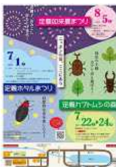
2017夏イベント案内チラシ(定義観光協会).jpg 111K