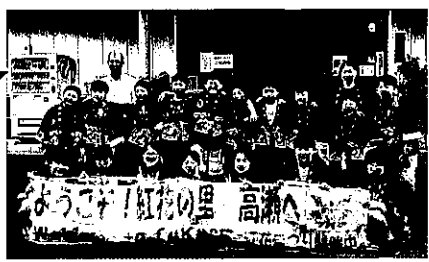
高瀬小児童によるバスガイド