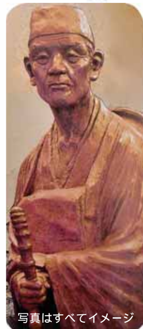
写真はすべてイメージ

旅行業務取扱管理者とは、お客様の旅行を取扱う営業所での取引責任者です。ご契約に関してご不明な点がございましたら、ご遠慮なく上記旅行業務取扱管理者にお尋ね下さい