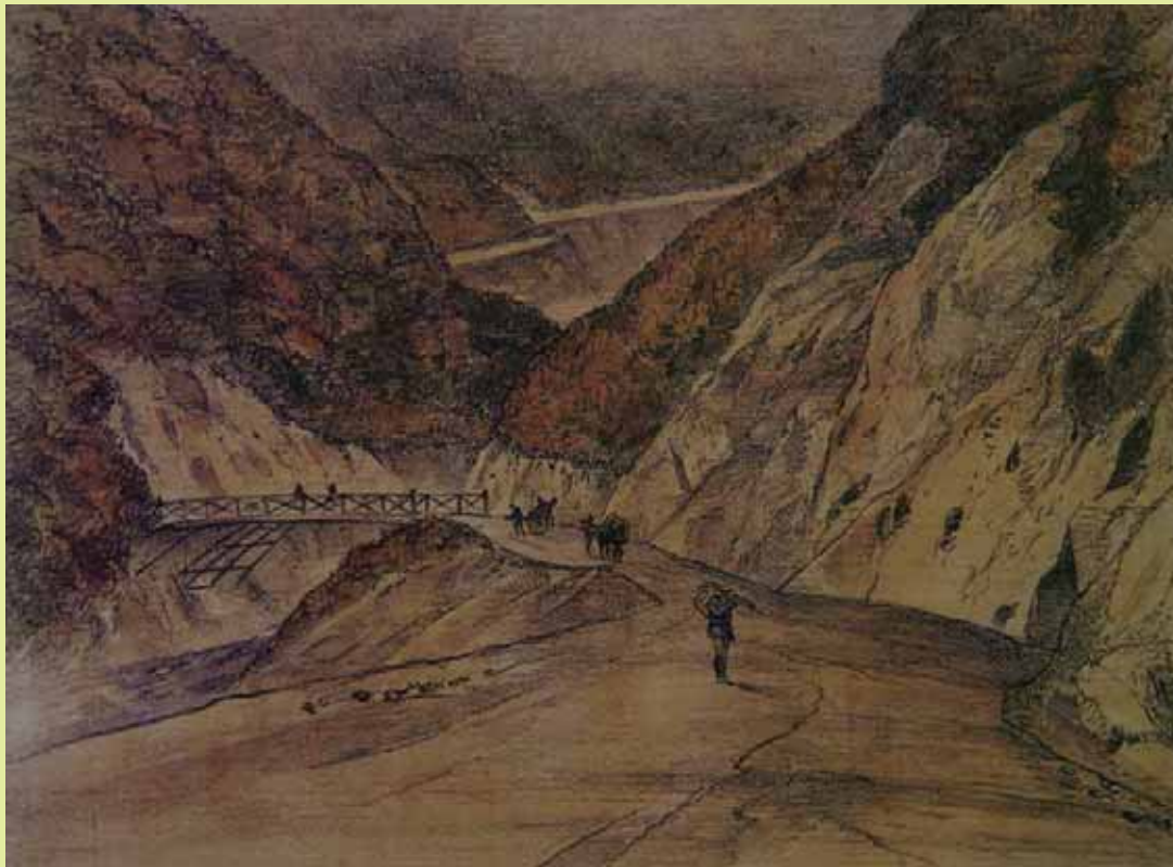
「北村山郡関山村新道ノ内字小屋ノ原ヨリ関山隧道ヲ望ム図」 画 高橋由一 山形県立図書館蔵