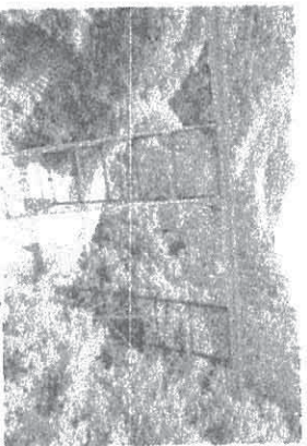
熊ヶ根トレススル橋

仙台市の西部、宮城地区には広瀬川（水）、仙山線（鉄）、関山街道（土）の3つの道が並行して走っています。平成26年に選定土木遺産に認定されたトレススル橋が熊ヶ根駅近くにあり、今では日本一の高さになっております。熊ヶ根は水の合流地点、街道の分岐点となっていて自然が織りなす風景が堪能できます。紅葉のウオーキングを楽しんでみませんか！関山街道の旧道、熊ヶ根周辺の史跡等を訪ねながら、往時を偲びます。長い坂道を上り降りしますので歩きやすい服装・靴でおいでください。