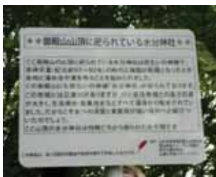
建て替えられた看板