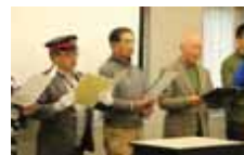
混声合唱団 音星達の皆さんによるオープニング:仙山線唱歌