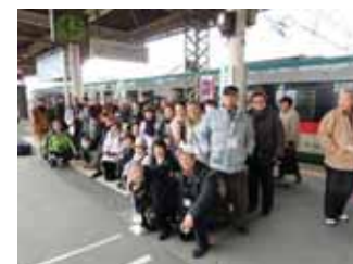
西北東北ローカル線の旅は小牛田駅ホームで記念撮影