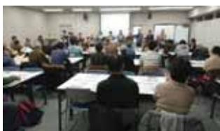
多くの方に参加いただきました

仙山線各駅のキーパーソンによる過去・現在・未来の座談会。仙山線への思いを残そうワークショップ。大回り乗車で人々の息吹に熱い思いやり(高専生)。雪・風・雨で絶対列車を止めなかった(大正生まれの国鉄員)。通勤、通学、列車の旅、苦い・懐かしい思い出、みんなで語りあいました。仙山線の歴史、風土、文化を互いに理解して豊かな沿線の連携、次代へ継続できればと思います。