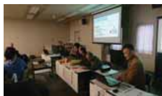
過去・現在・未来の座談会