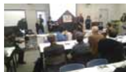
劇団ひろせによる紙芝居上映「鉄太の仙山線物語」