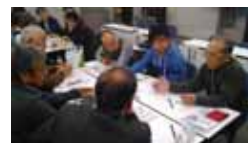
ワークショップで、みんなで語りあいました