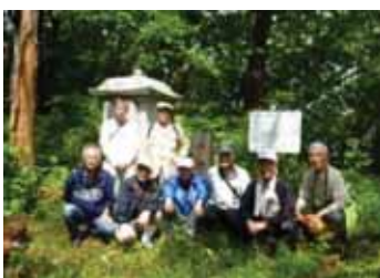
御殿山・水分(みくまり)神社前で記念撮影