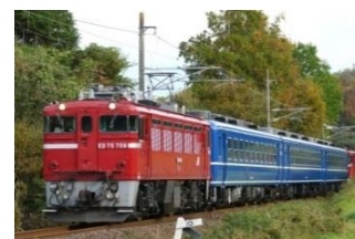
ED75 機関車・12 系客車 (イメージ)