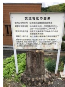
＜作並駅 交流電化発祥地の碑＞

作並～山寺間は作山トンネル（奥新川～山寺駅間）における SL の煤煙対策等により、先に直流電化されており、作並駅を基地として、交流電気機関車の試験が北仙台～作並駅間で実施されました。交流電化の発展は、大出力・高速で走る新幹線の開発を成功に導いた土台となる技術として大きな役割を果たしています。その試験線に選ばれたのが仙山線でした。